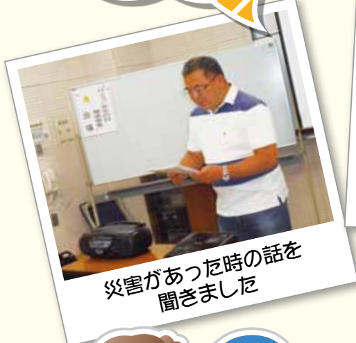
災害があった時の話を聞きました