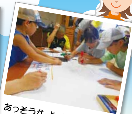
あっそうが、よく気がついたね