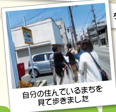
自分の住んでいるまちを見て歩きました