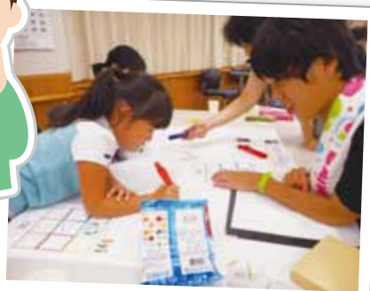
見つけたもの、気がついたことをまとめよう