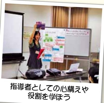
指導者としての心構えや役割を学ぼう