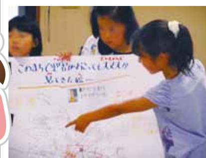
わたしたちが普段の生活で、「その時にどうするか」を考えることが大事です