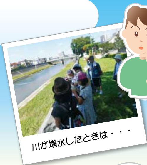
川が増水したときは・・・