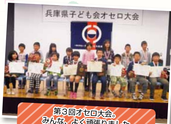
第3回オセロ大会。 みんな、よく頑張りました