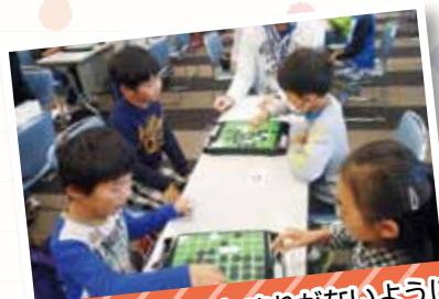
よく見て 返しやすれないように