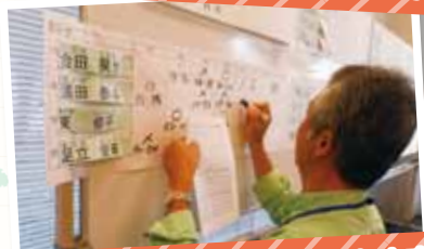
対戦が終われば成績が発表されます